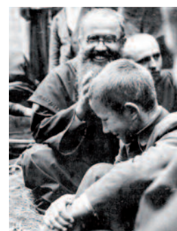
Le Père Kolbe : admirable gardien du plus grand couvent du monde !