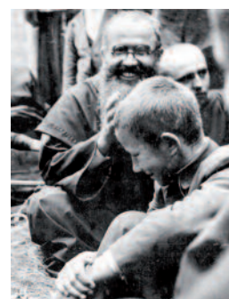
Le Père Kolbe : admirable gardien du plus grand couvent du monde !